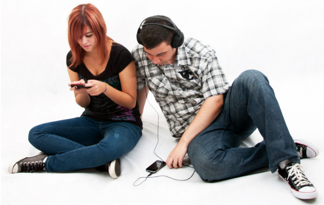
Figura 2: Jovem e Celular.

Especificamente em atividades matemáticas, é fundamental a crítica relativa aos resultados obtidos na máquina, como no caso das aproximações de números com infinitas casas decimais. O que é uma limitação “natural” da máquina pode possibilitar uma discussão frutífera com os estudantes, que envolve um “preconceito” relativo à tão difundida exatidão na Matemática. De fato, numa máquina, seja ela uma calculadora relativamente simples ou o mais sofisticado computador,